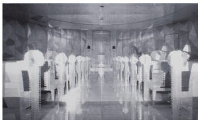
「Moment' s #44」 2020 H900×W1500 mm アクリル、キャンバス、木製パネル

https://sites.google.com/site/furuhatatomoki/