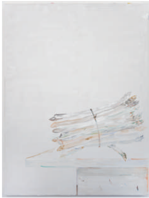
「Asparagus」 2020 H1307×W975 mm 油彩、キャンバス