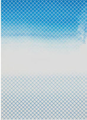
「touch here, look there」 2018 H750×W560 mm 紙、インク、ピグメント